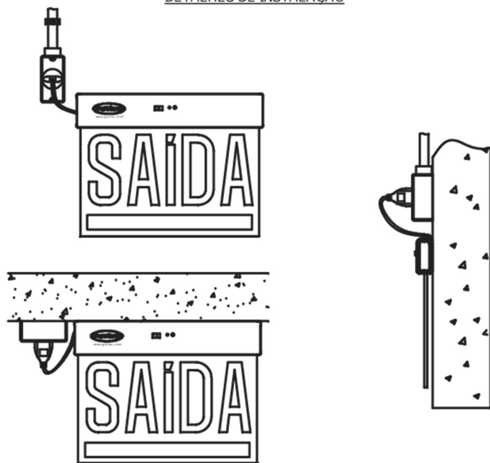
DETALHES DE INSTALAÇÃO

A placa de saída Securimax possui um suporte que possibilita a instalação lateral ou pendurada da placa. Fixe o suporte na parede com o parafuso e encaixe a placa de saída no suporte.